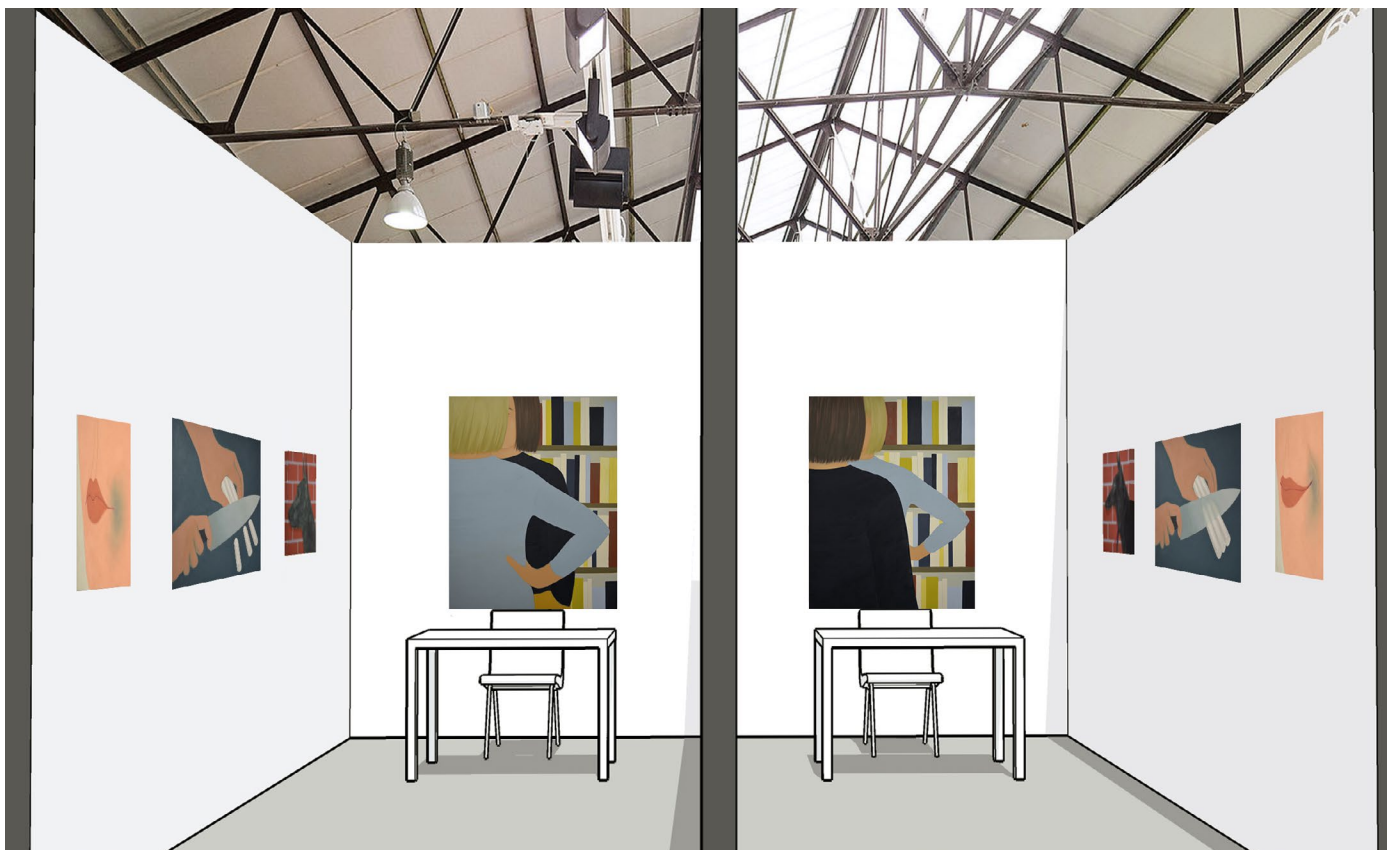
Simulation stand Art Brussels 2020