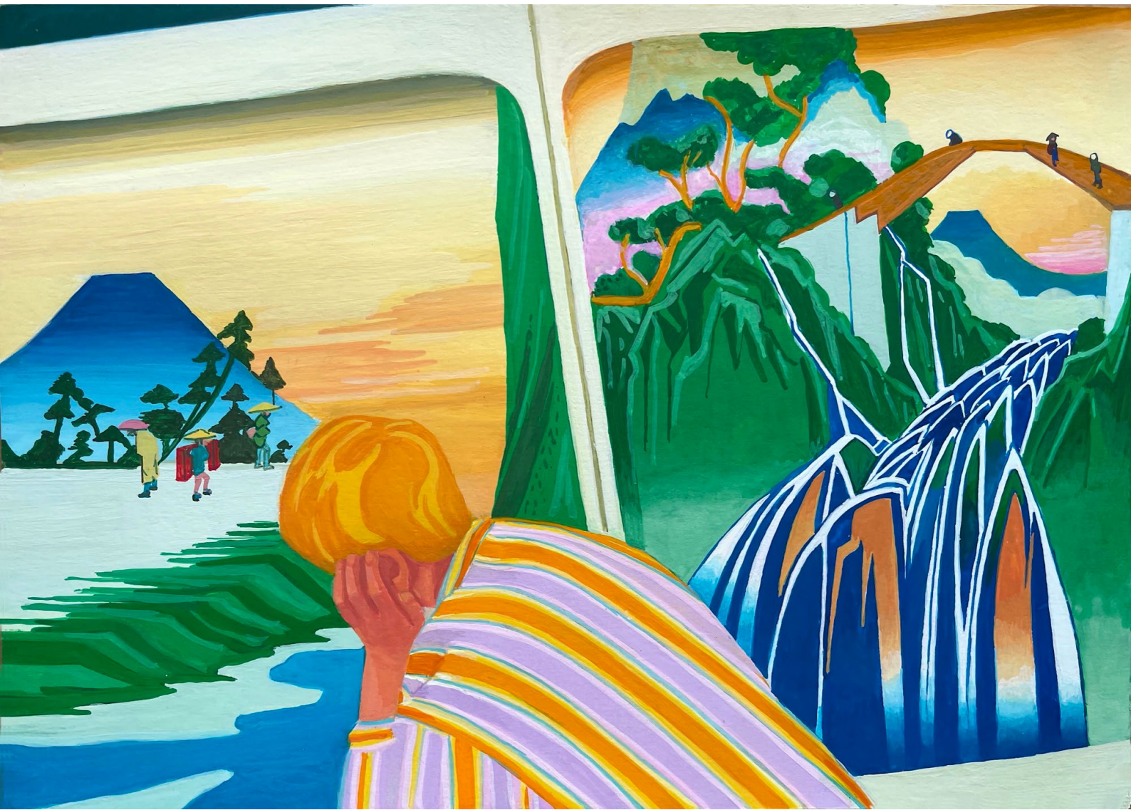
MC Mitout Les plus belles heures, 2023 Gouache sur papier 21 x 29,7 cm