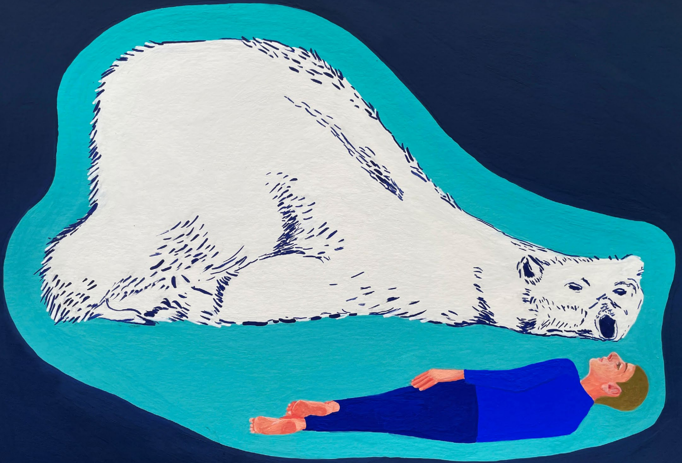
MC Mitout Les plus belles heures , 2023 Gouache sur papier 21 x 29,7 cm