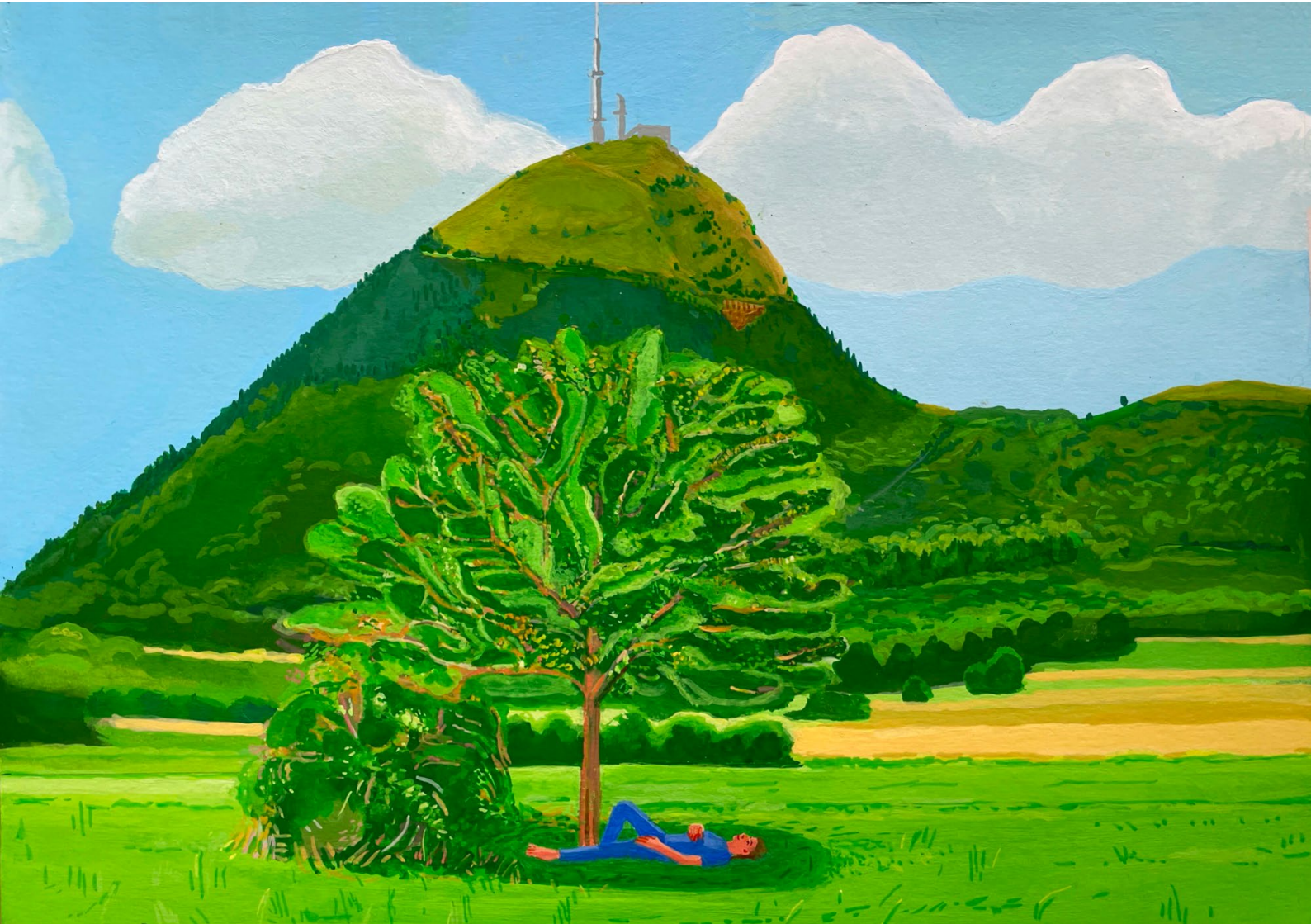
MC Mitout Les plus belles heures , 2023 Gouache sur papier 21 x 29,7 cm