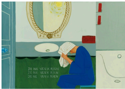
Exposition à la Galerie Claire Gastaud, 2021 © Margot Montigny / Exposition à la Galerie Claire Gastaud, 2021 © Margot Montigny / Août 2018, Série 5/35, Sur les pas de Sophocle, les amphores sous-marines comme les yeux d'Édipe - Épidaure / Février 2017, Série 4/181, Shampooing - La Demi-Lune, Collection privée