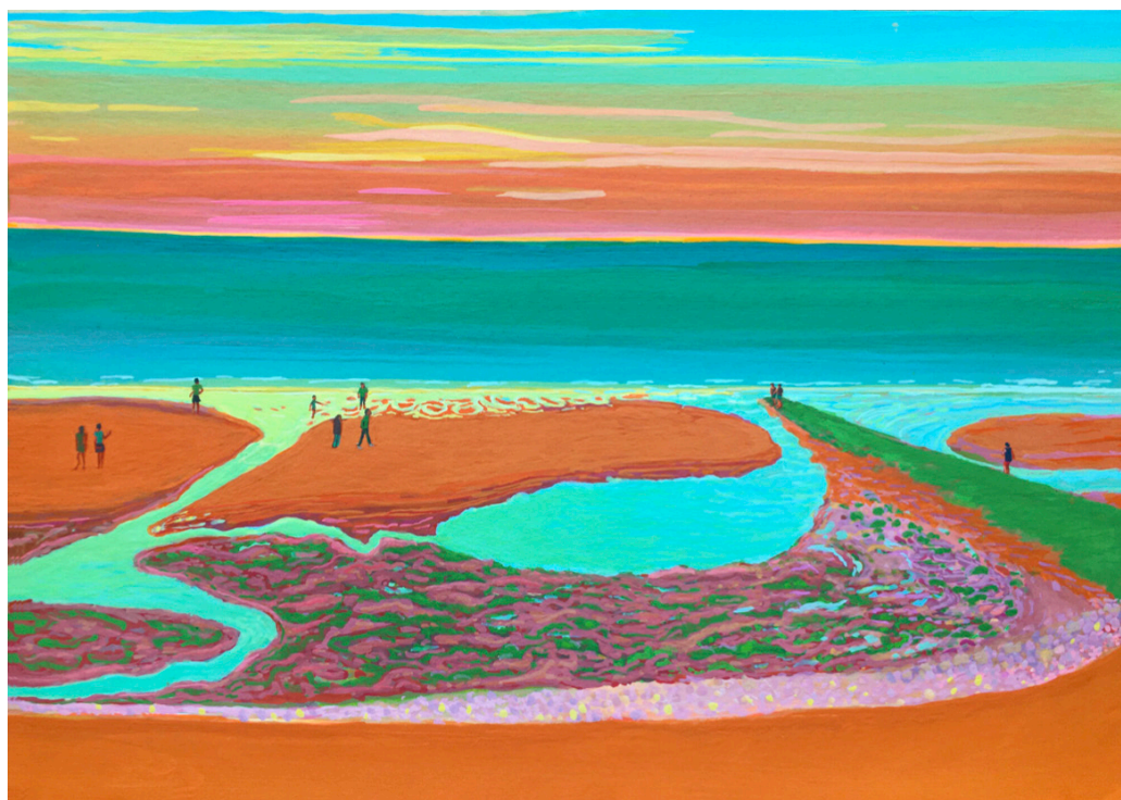
Marie Claire Mitout, Août 2022, Série 5, Fin de jour à Villers