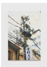
Erik Schmidt Oji , 2018 Signed and dated on the back Oil on print on canvas 138 x 92 cm (ERS 19)