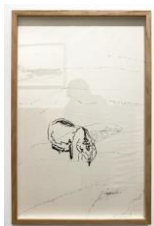
Delphine Gigoux-Martin Le petit ours, diptyque 1/2, 2023 Fusain et encre sur papier de Chine 64 x 41 cm Oeuvre encadrée (DGM 146)