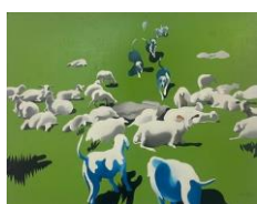
Henri Cueco Untitled Acrylic on canvas 80 x 100 cm (HC 91)