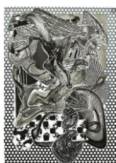
Frank Stella Riallaro, (Black & White) , 1994 Screenprint, lithograph, etching, relief, aquatint, collagraph on white TGL handmade paper 116.8 x 81.3 cm