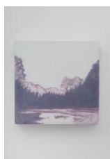
Jean-Charles Eustache For those who walk in darkness, 2023 Acrylic on wood panel 20 x 20 cm (JCE 144)