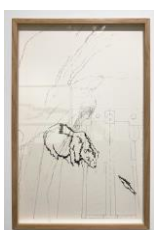
Delphine Gigoux-Martin Le petit ours, diptyque 2/2, 2023 Fusain et encre sur papier de Chine 64 x 41 cm Oeuvre encadrée (DGM 147)