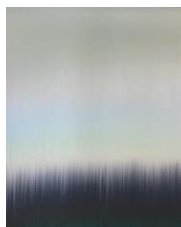
Claire Chesnier 140222, 2022 Ink on paper 171 x 136 cm (CC1)