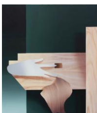
Judith Grassl Arrange, 2023 Acrylic on wood 65 x 55 cm (JG 08)