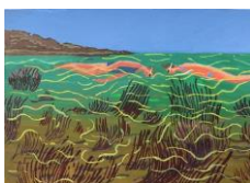
MC Mitout Les plus belles heures, Les plongeuses, Le grand Boutarel , Juillet 2015 Gouache on paper 19,7 x 28,7 cm (MCM Série 4_40-135)