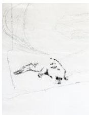
Delphine Gigoux-Martin Bébé phoque, 2023 Charcoal on China paper 126 x 75,5 cm Oeuvre encadrée (DGM 141)