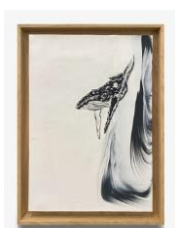
Delphine Gigoux-Martin Baleine, 2023 Fusain sur porcelaine, pigments 38 x 51,5 cm Oeuvre encadrée (DGM 149)