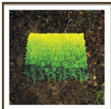
NILS-UDO Feuilles de chêne , 1986 Ilfochrome sur aluminium 100 x 100 cm N° 6/8 exemplaires (NU 42 BUCH)