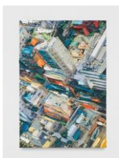
Erik Schmidt TBT , 2021 Signed and dated on the back Oil on Fine Art print canvas 108 x 72 cm (ERS 12)