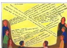
MC Mitout Les plus belles heures, A voix haute, La demi-lune, Juillet 2014 Gouache on paper 19,7 x 28,7 cm (MCM Série 4_35-048)