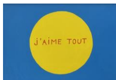
MC Mitout J'aime tout , 2020 Gouache on paper 21 x 29,7 cm (MCM 76 Série 5_)