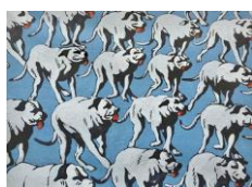
Henri Cueco Chiens à répétition sur fond bleu, 1993 Acrylic on canvas 60 x 73 cm (HC 23)