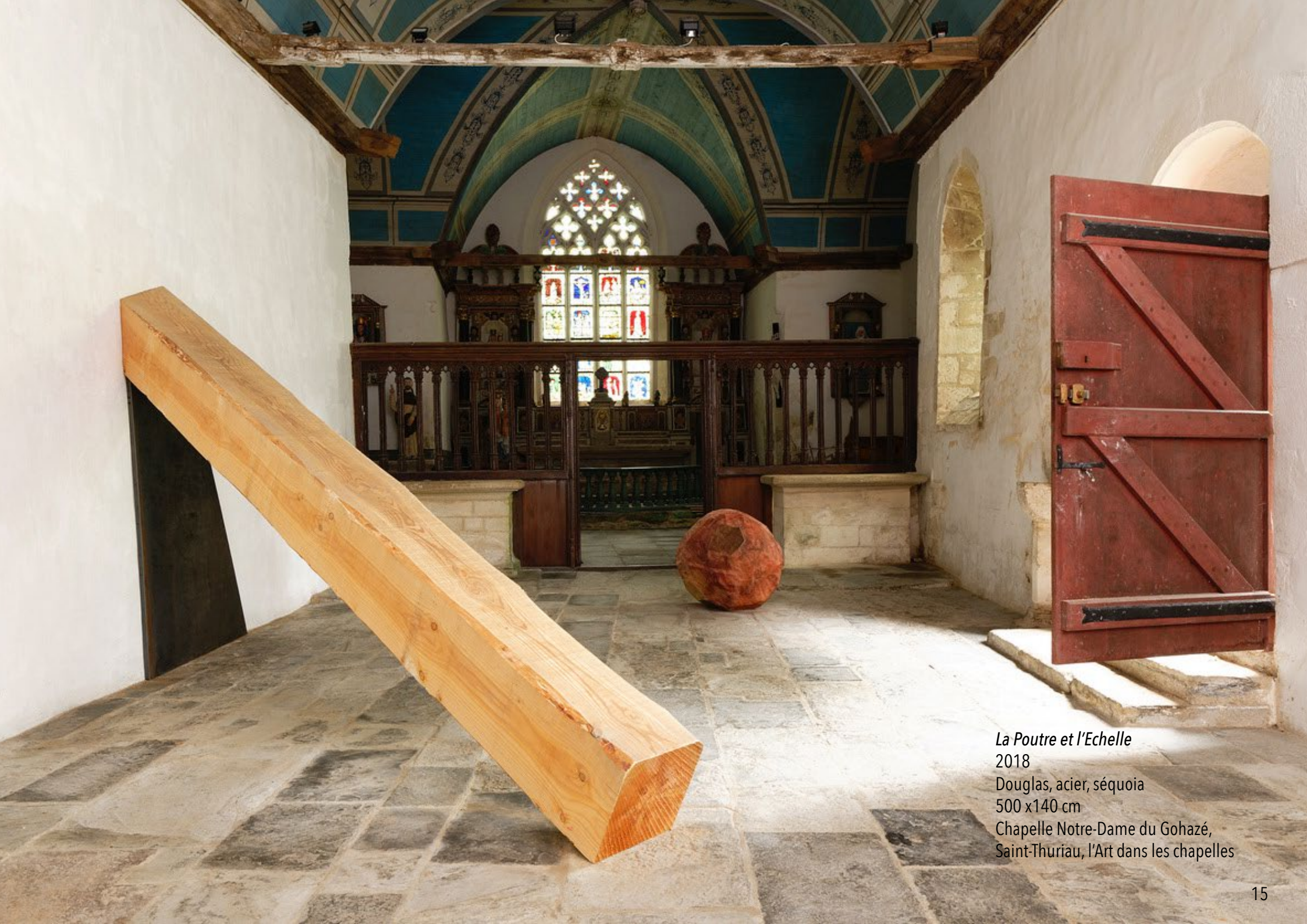
La Poutre et l'Echelle 2018 Douglas, acier, séquoia 500 x140 cm Chapelle Notre-Dame du Gohazé, Saint-Thuriau, l'Art dans les chapelles