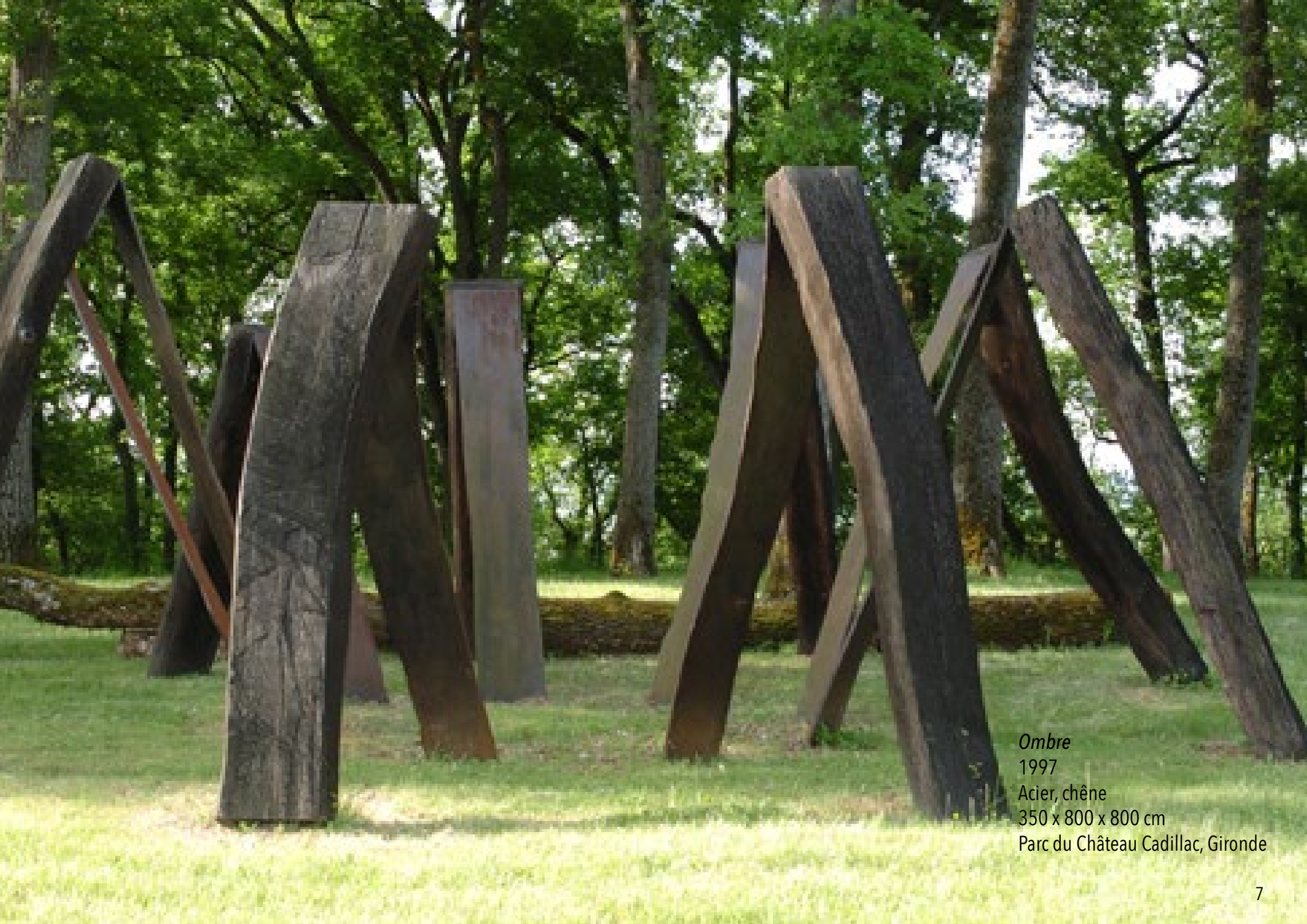
Ombre 1997 Acier, chêne 350 x 800 x 800 cm Parc du Château Cadillac, Gironde