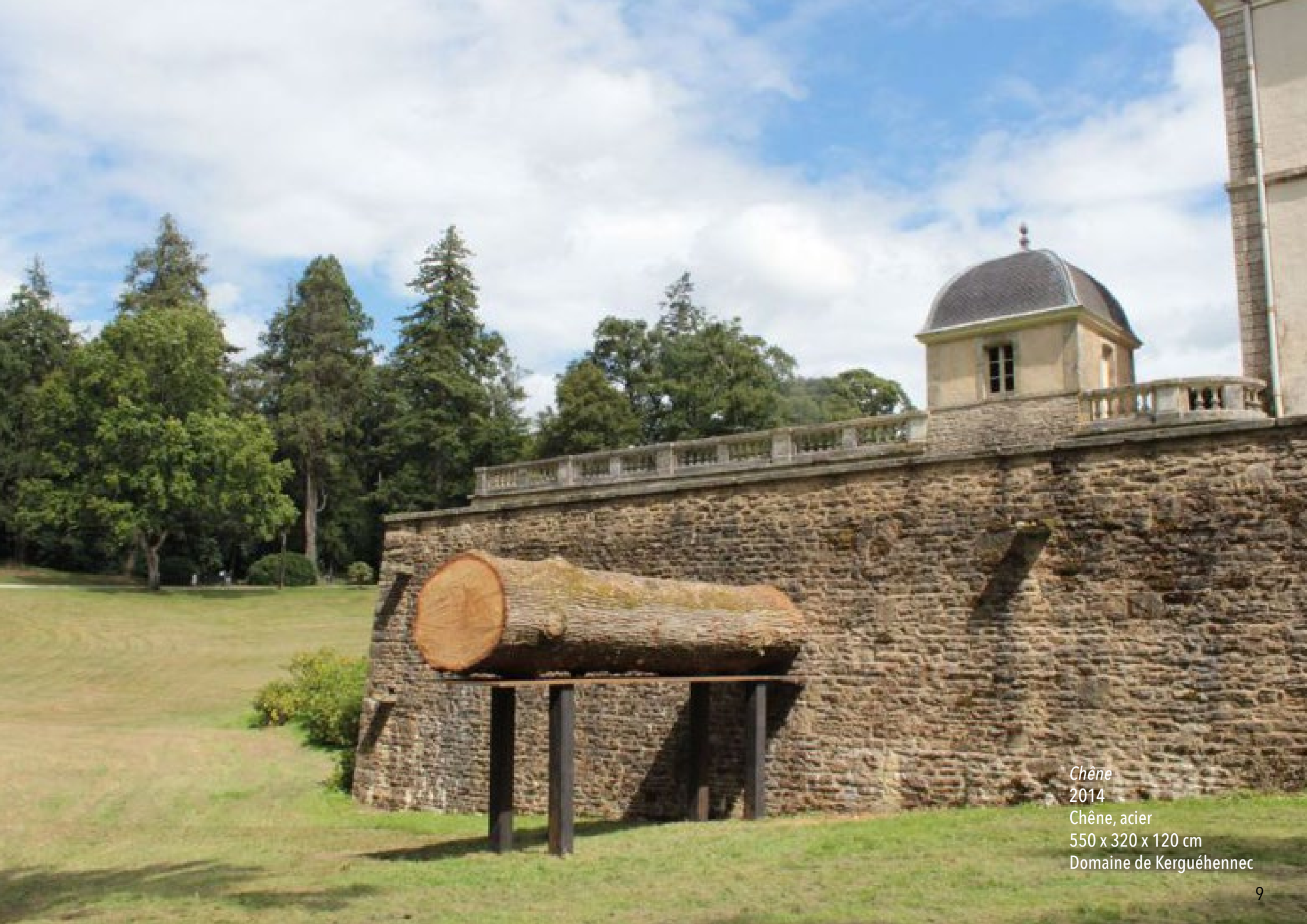
Chêne 2014 Chêne, acier 550 x 320 x 120 cm Domaine de Kerguéhenec