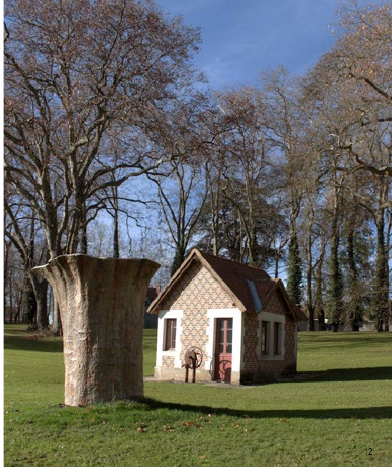
Platane 2015 Gesmonite, terre crue 270 x 180 x 150 cm Parc du Domaine Royal de Randan