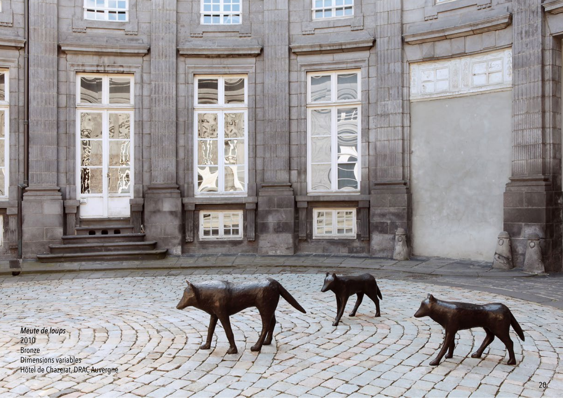
Meute de loups 2010 Bronze Dimensions variables Hôtel de Chazerat, DRAC Auvergne