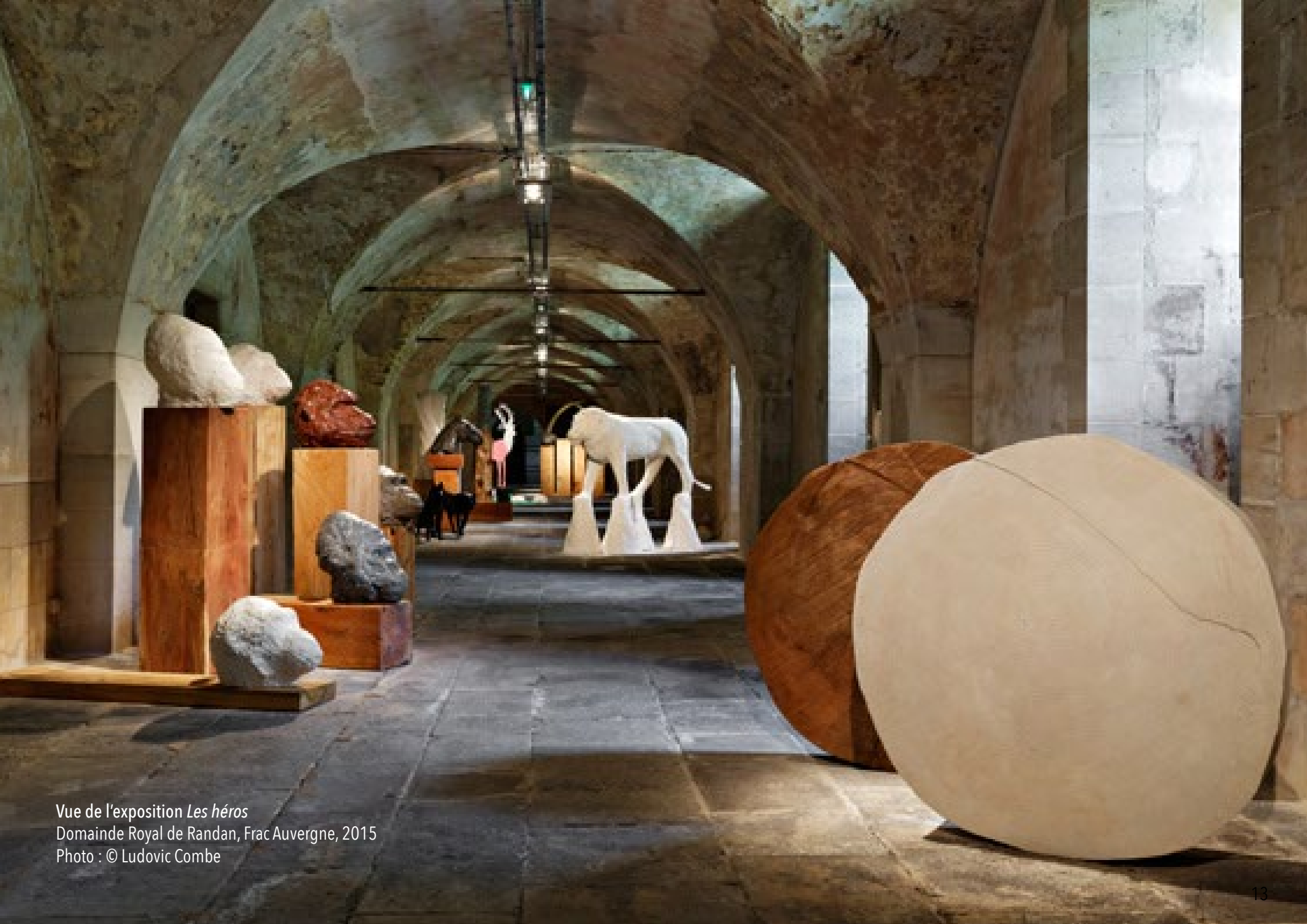
Vue de l'exposition Les héros Domaine Royal de Randan, Frac Auvergne, 2015