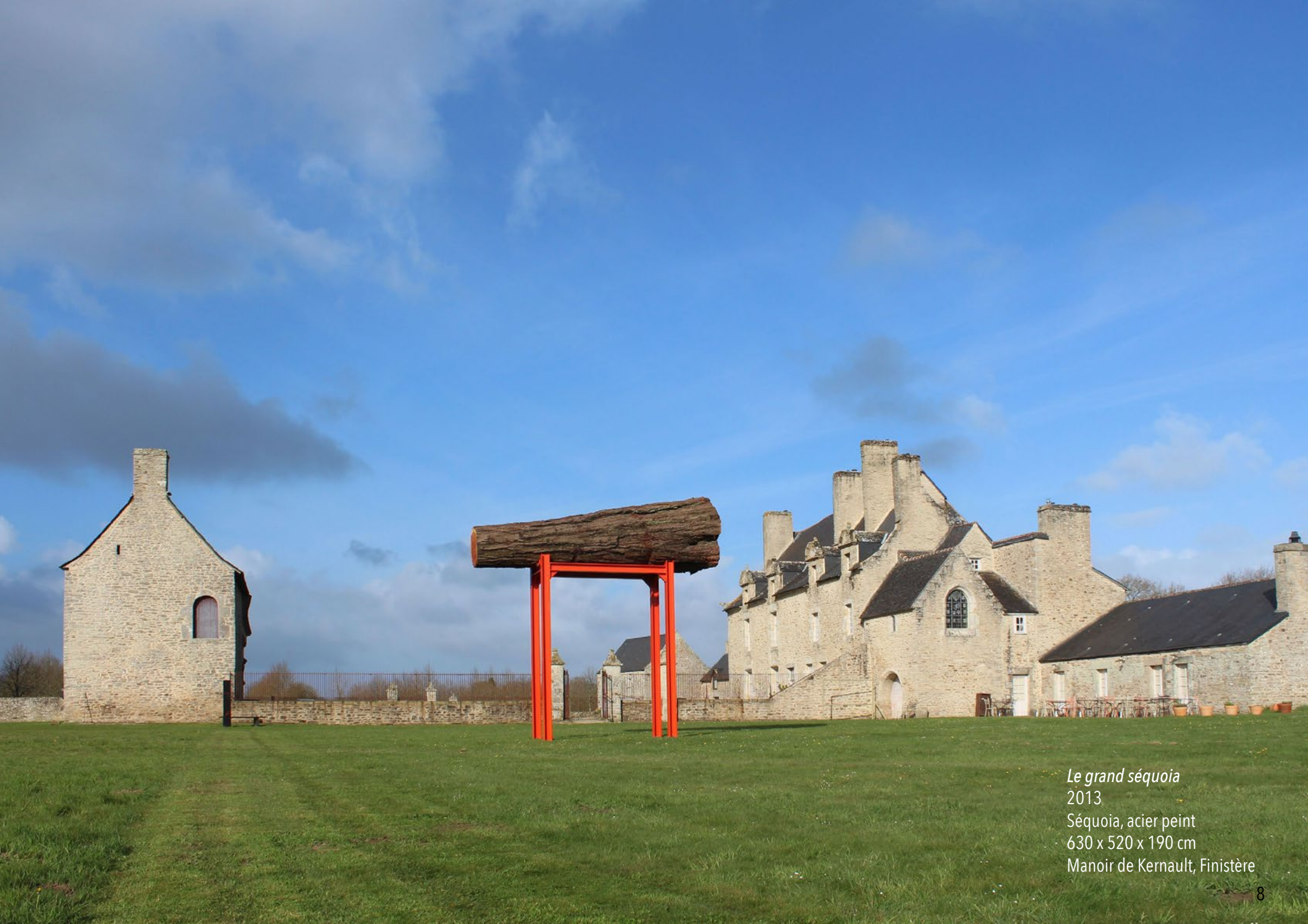
Le grand séquoia 2013 Séquoia, acier peint 630 x 520 x 190 cm Manoir de Kernault, Finistère