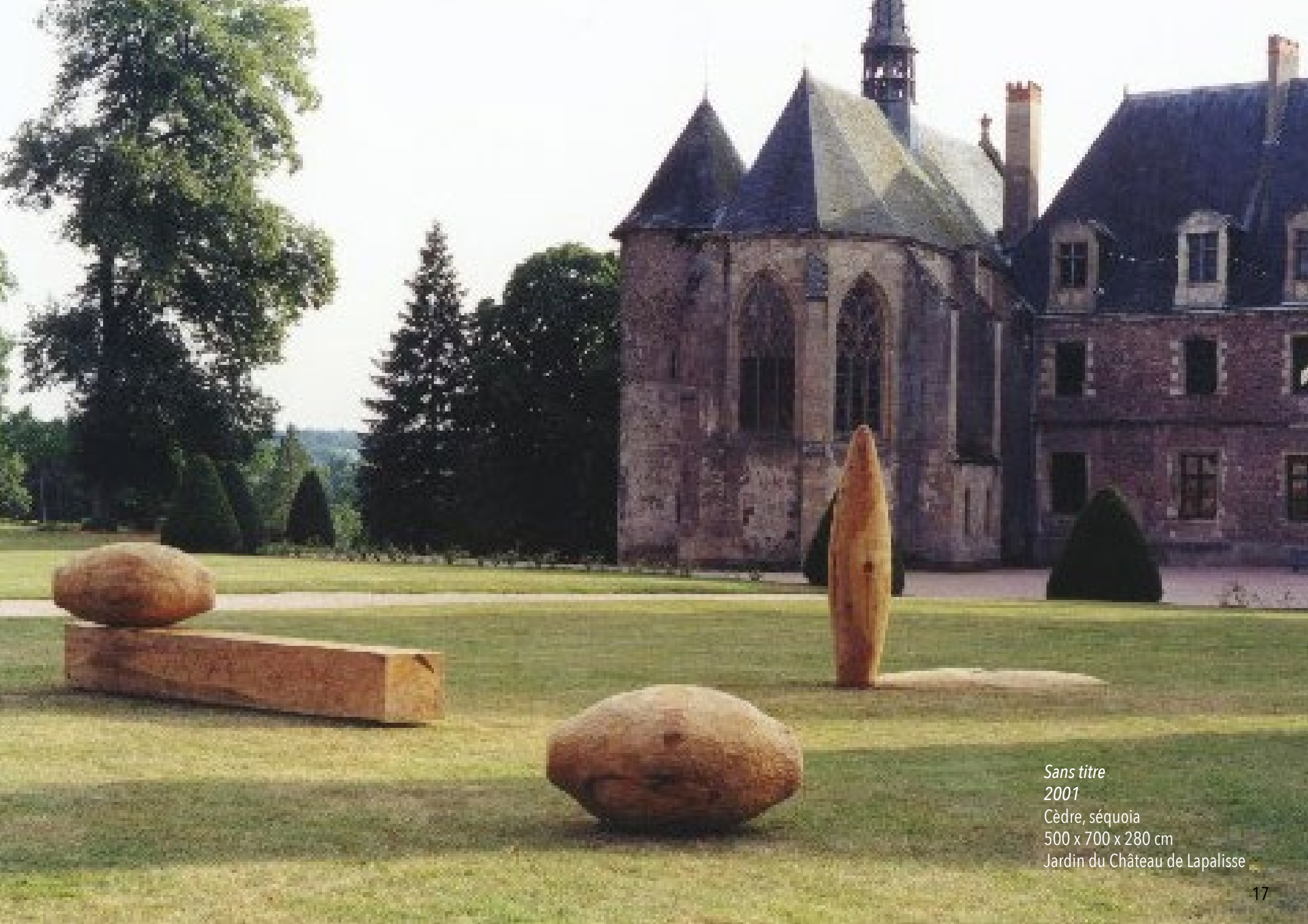
Sans titre 2001 Cèdre, séquoia 500 x 700 x 280 cm Jardin du Château de Lapalisse