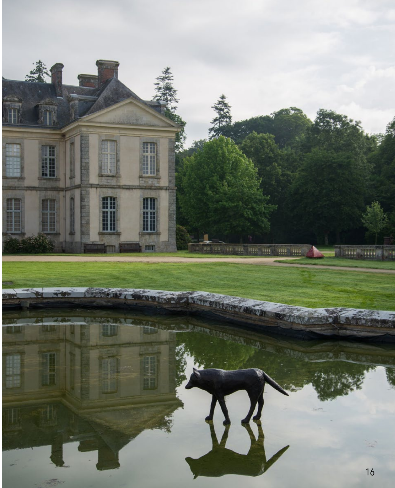
La traversée 2015 Bronze 130 x 70 x 35 cm