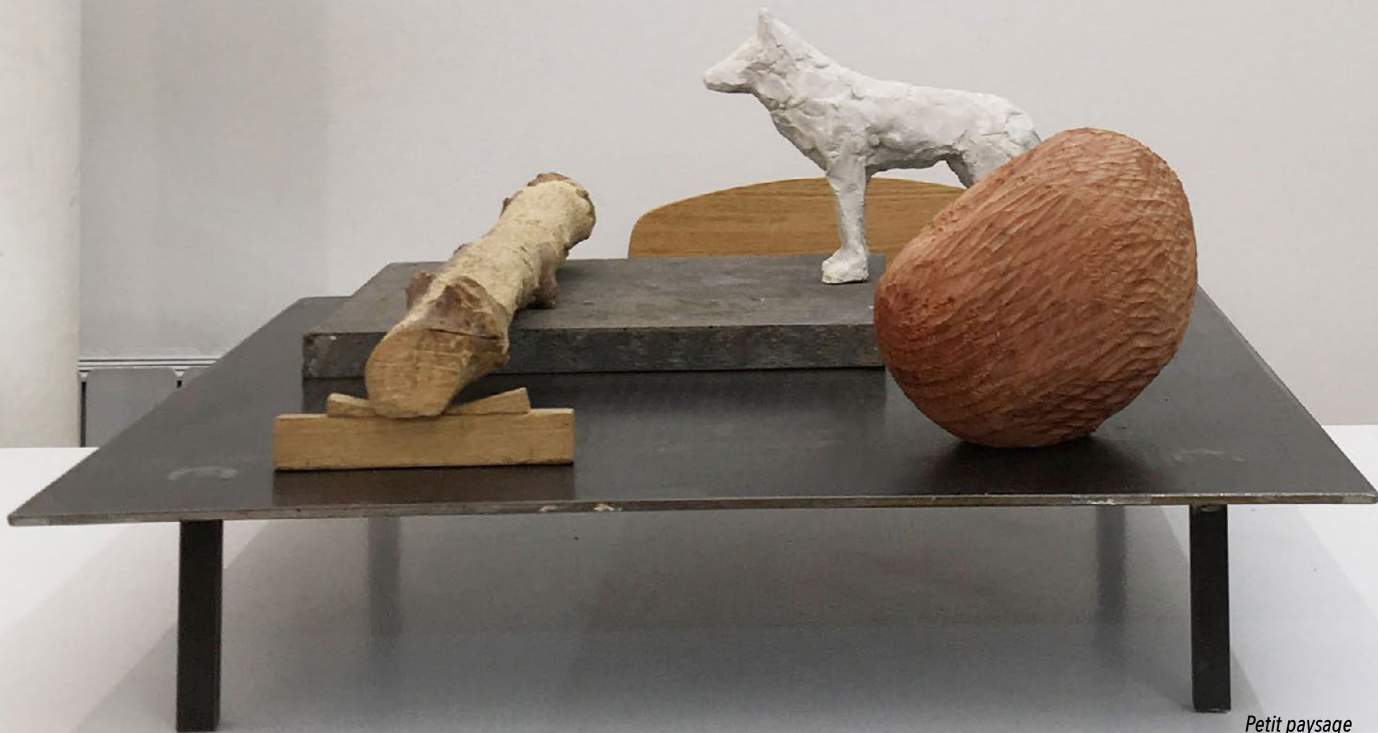
Petit paysage 2007 Acier, pierre, bois, plâtre 50 x 30 x 23 cm