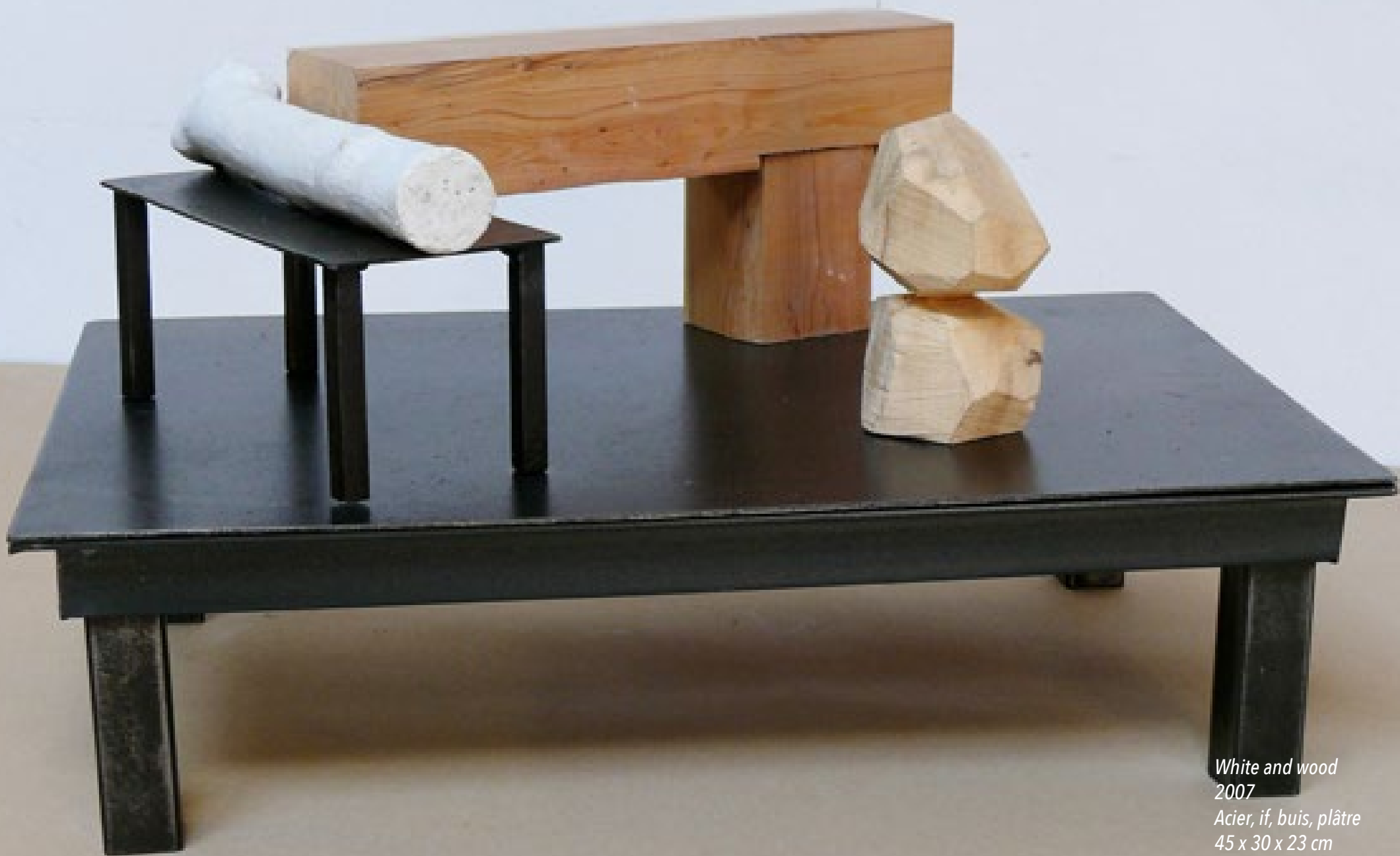
White and wood 2007 Acier, if, buis, plâtre 45 x 30 x 23 cm