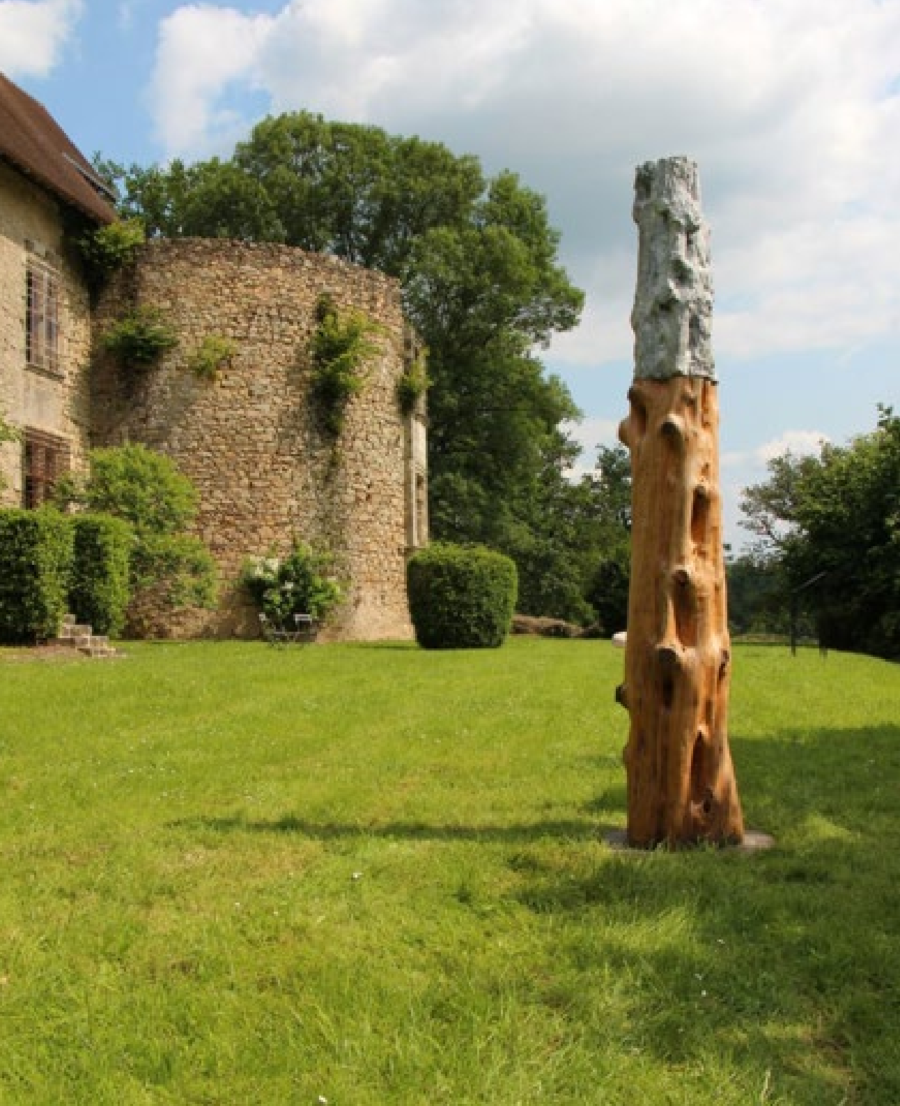
If 2004 If et ciment moulé 250 x 45 cm