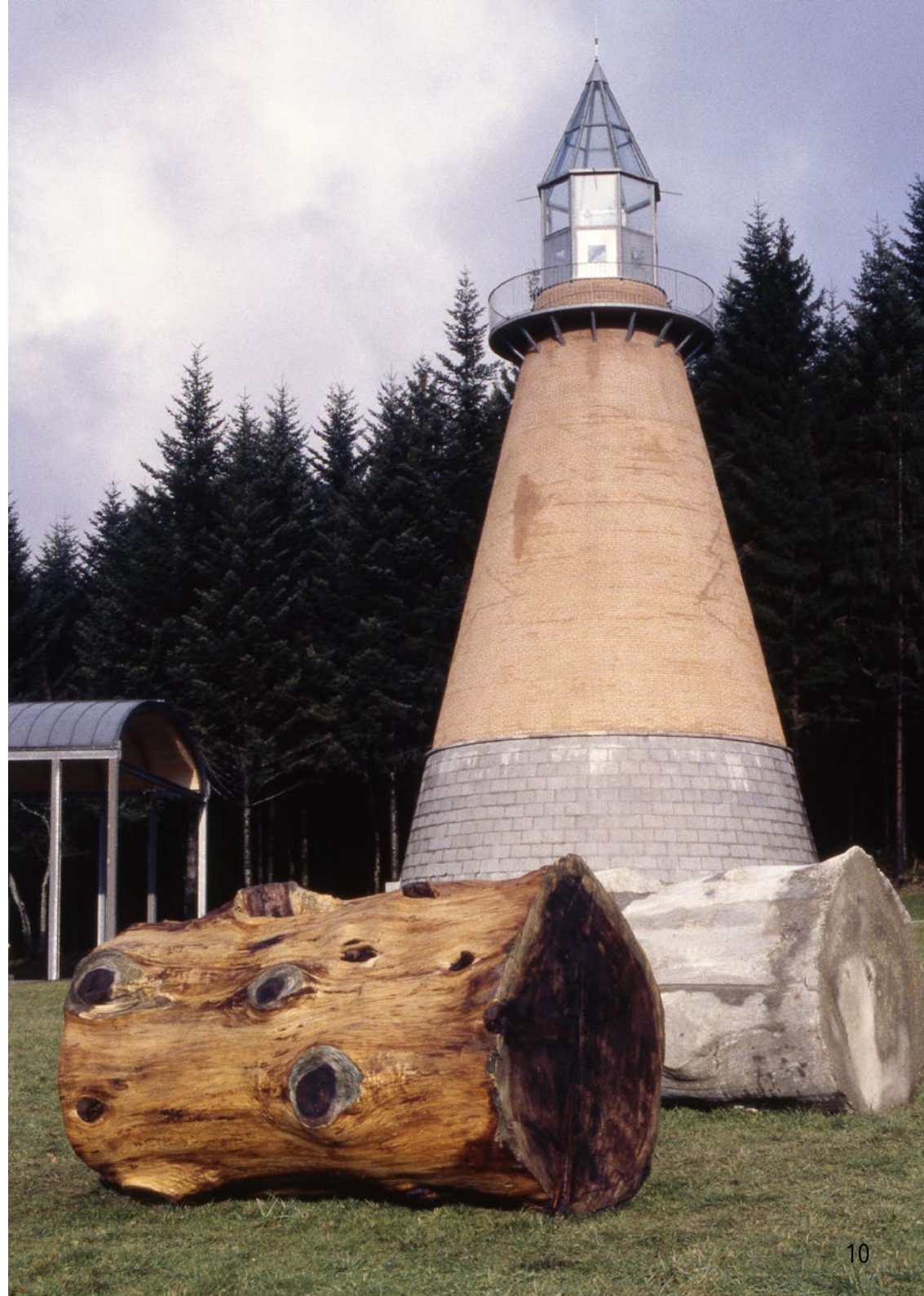
Moulage 1993-1994 Séquoia, ciment 400 x 220 cm Centre international de l'art et du paysage, Ile de Vassivière