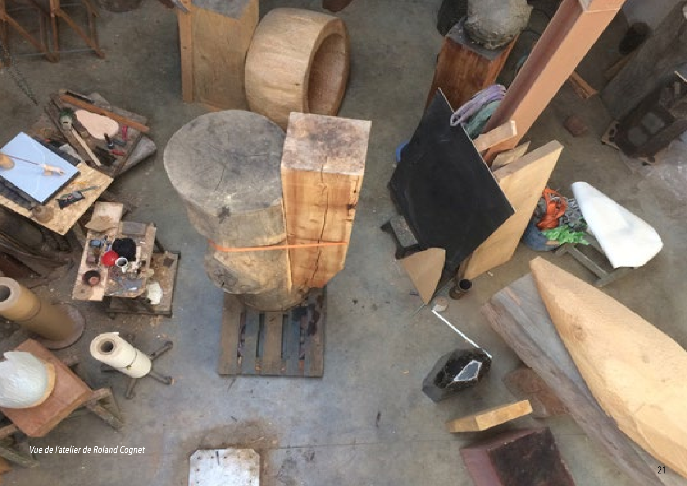
Vue de l'atelier de Roland Cognet