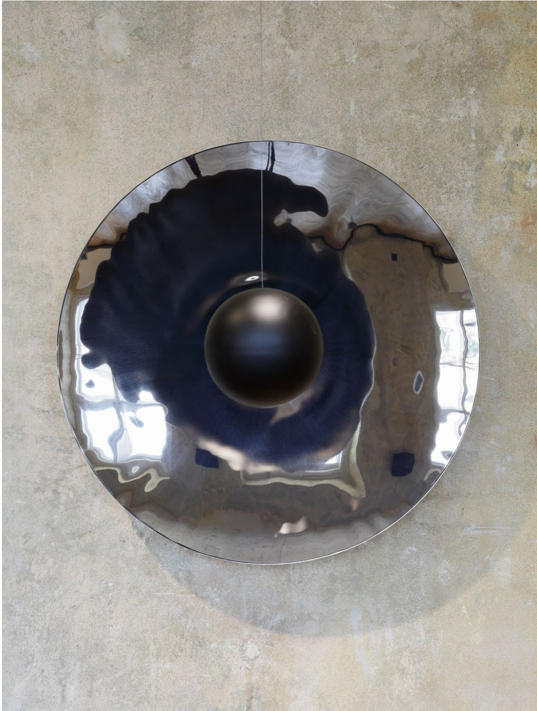
Deux points , 1995 - 2018 Acier inoxydable poli miroir Ø 95 x 8 cm, acier peint noir, Ø 15 cm, Mécanisme de pendule