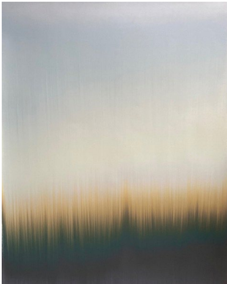
Claire Chesnier Sans titre , 2022 Encre sur papier 172 x 135 cm