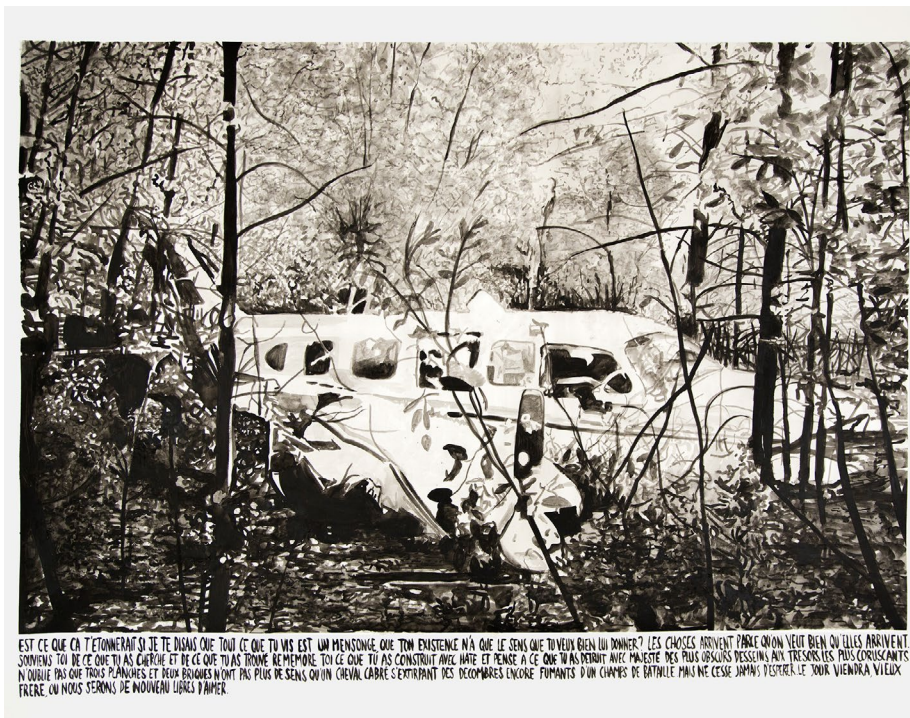
Léo Dorfner Le jour viendra, vieux frère, où nous serons de nouveau libre d'aimer , 2016 Aquarelle sur papier 125 x 170 cm