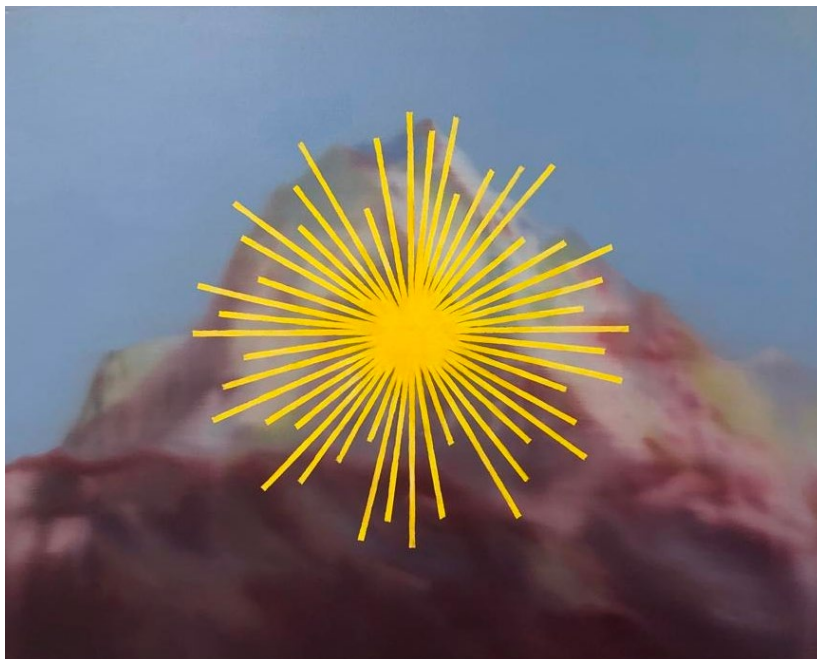
Coraline de Chiara Sans titre , 2023 Huile sur toile 60 x 81 cm