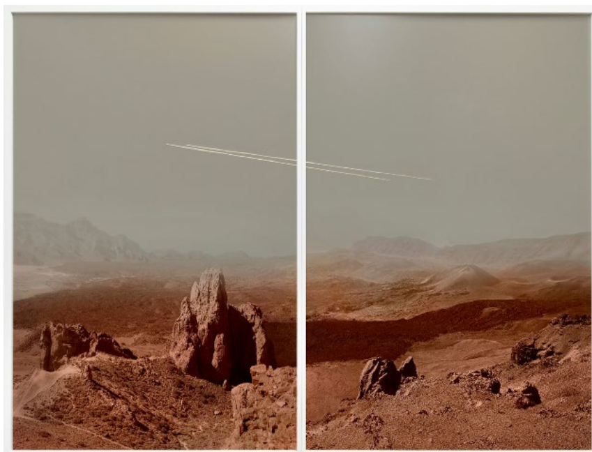
David de Beyter Magical place IV, 2018 Impression chromogénique 144 x 95 x 2 cm