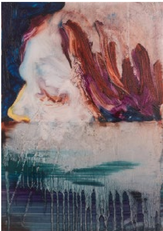
Sarah Jérôme En eaux vives 6 , 2023 Huile sur papier calque 42 x 31 cm Courtesy de l'artiste