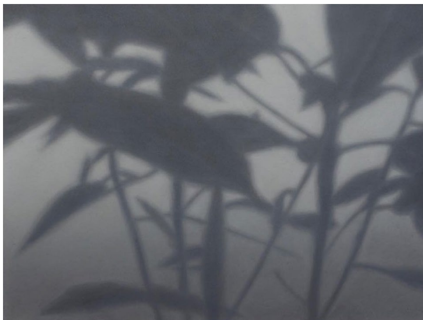
David Kowalski We take it from here, 2021 Huile, vernis mat sur panneau 20 x 27,5 cm Courtesy galerie Dilecta