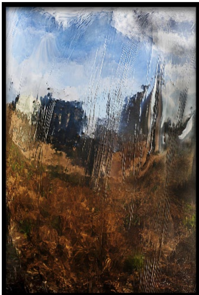
Tania Mouraud Borderland 0683, 2010 Encres pigmentaires sur papier Fine Art 169 x 114 x 4 cm