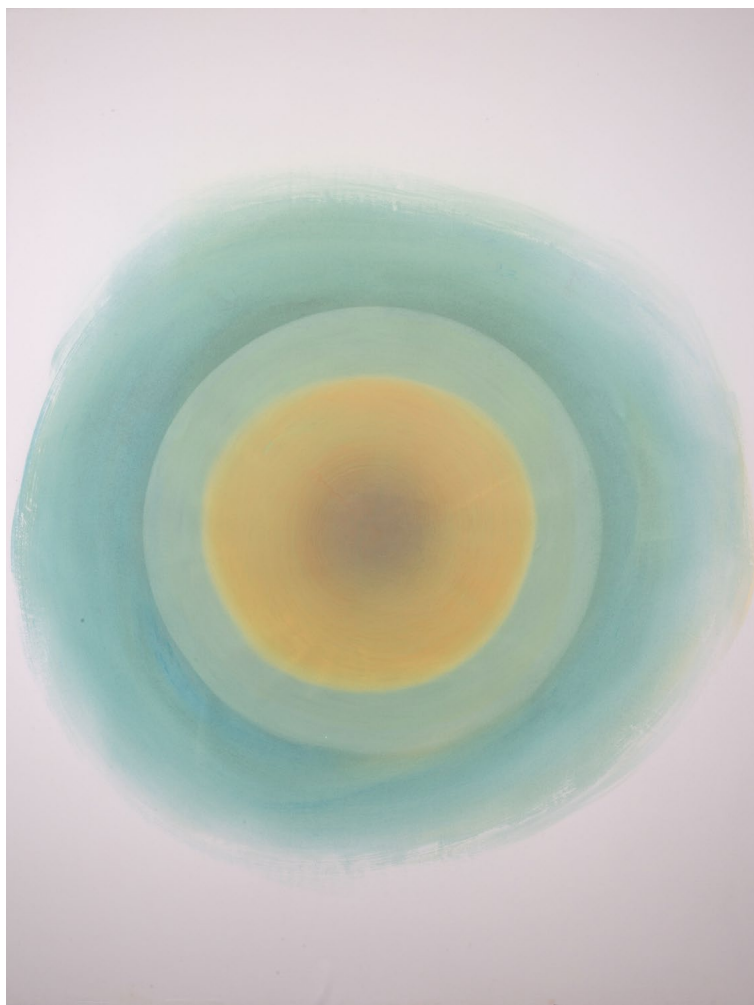
Mustapha Azeroual Sans titre , 2021 Tirage multi-couches à la gomme bichromatée polychrome 130,5 x 95,5 cm Courtesy galerie Binome