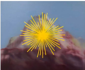
Coraline de Chiara