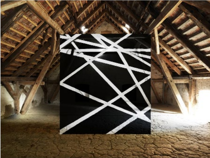
Georges Rousse Drewen , 2003 Photographie montée sur aluminium 125 x 160 cm