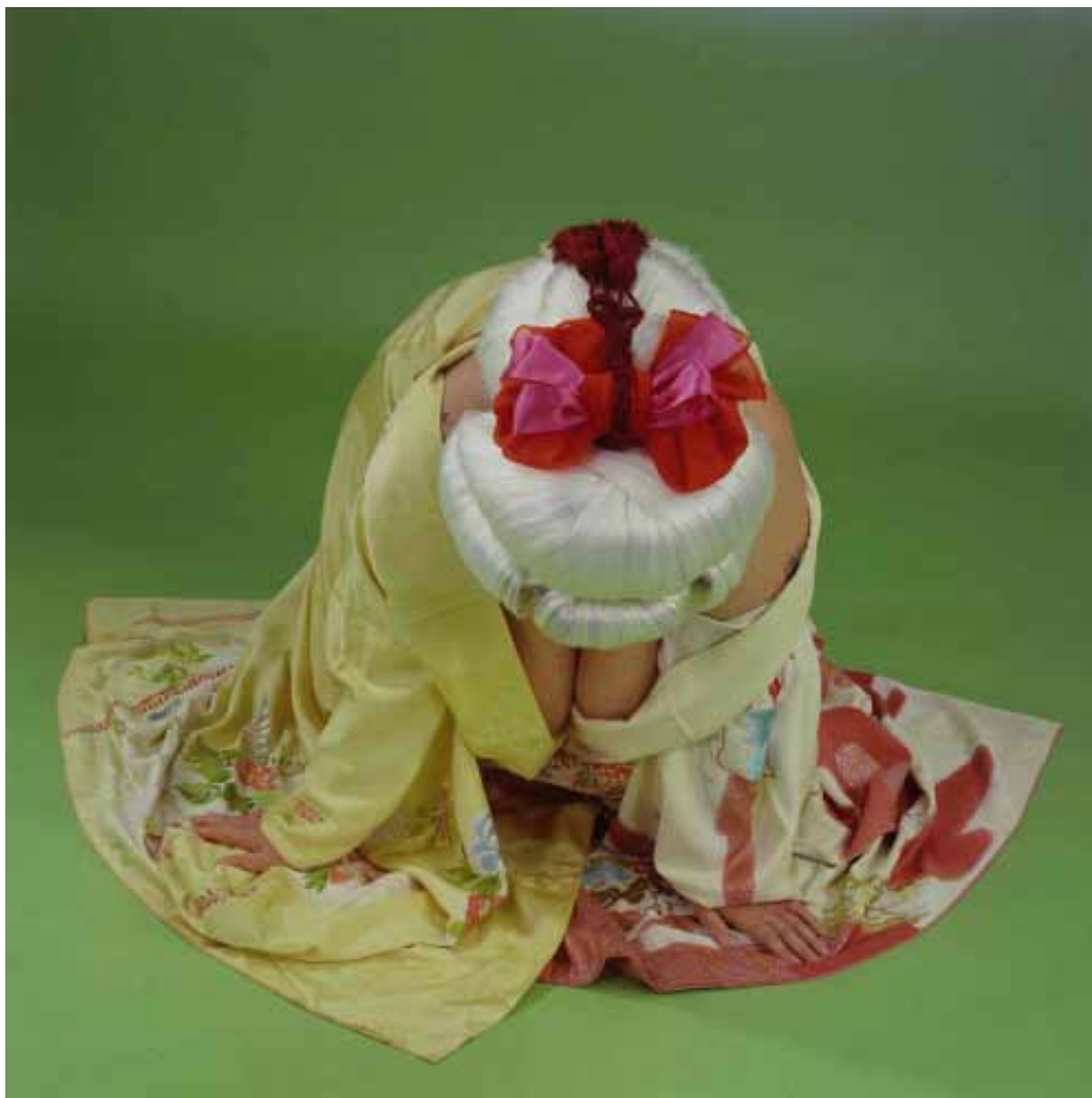
YBANA 2006, Tirage argentique cibachrome, 120 x 120 cm