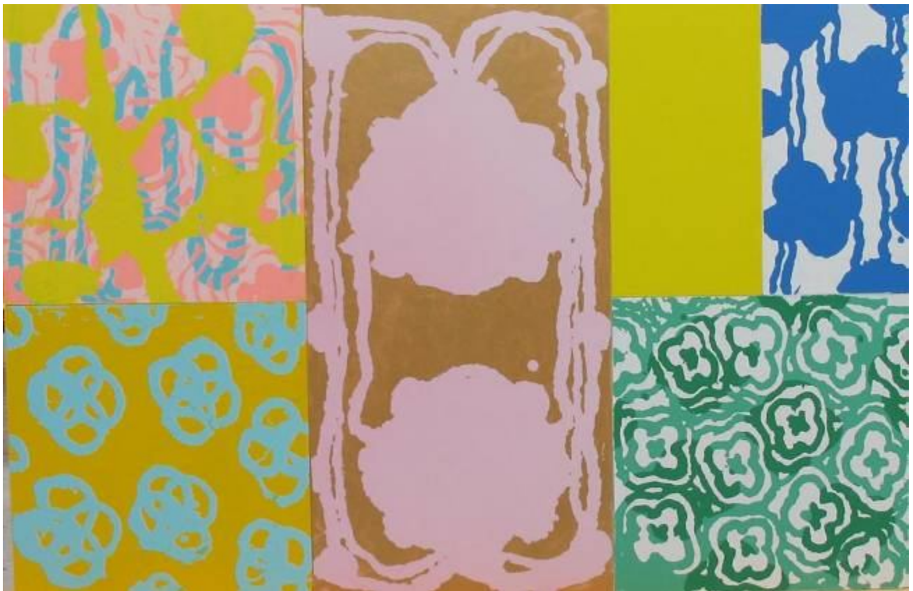
Jacques BOSSER Kuki 2013 Pigments sur panneaux de bois 150x100cm