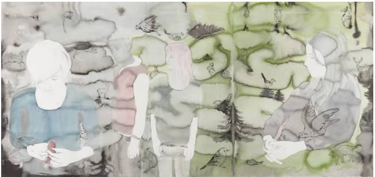
Françoise PETROVITCH Lorsque la forêt s'éclaircit, 2014, Ensemble rehaussé en sérigraphie, 400x200cm