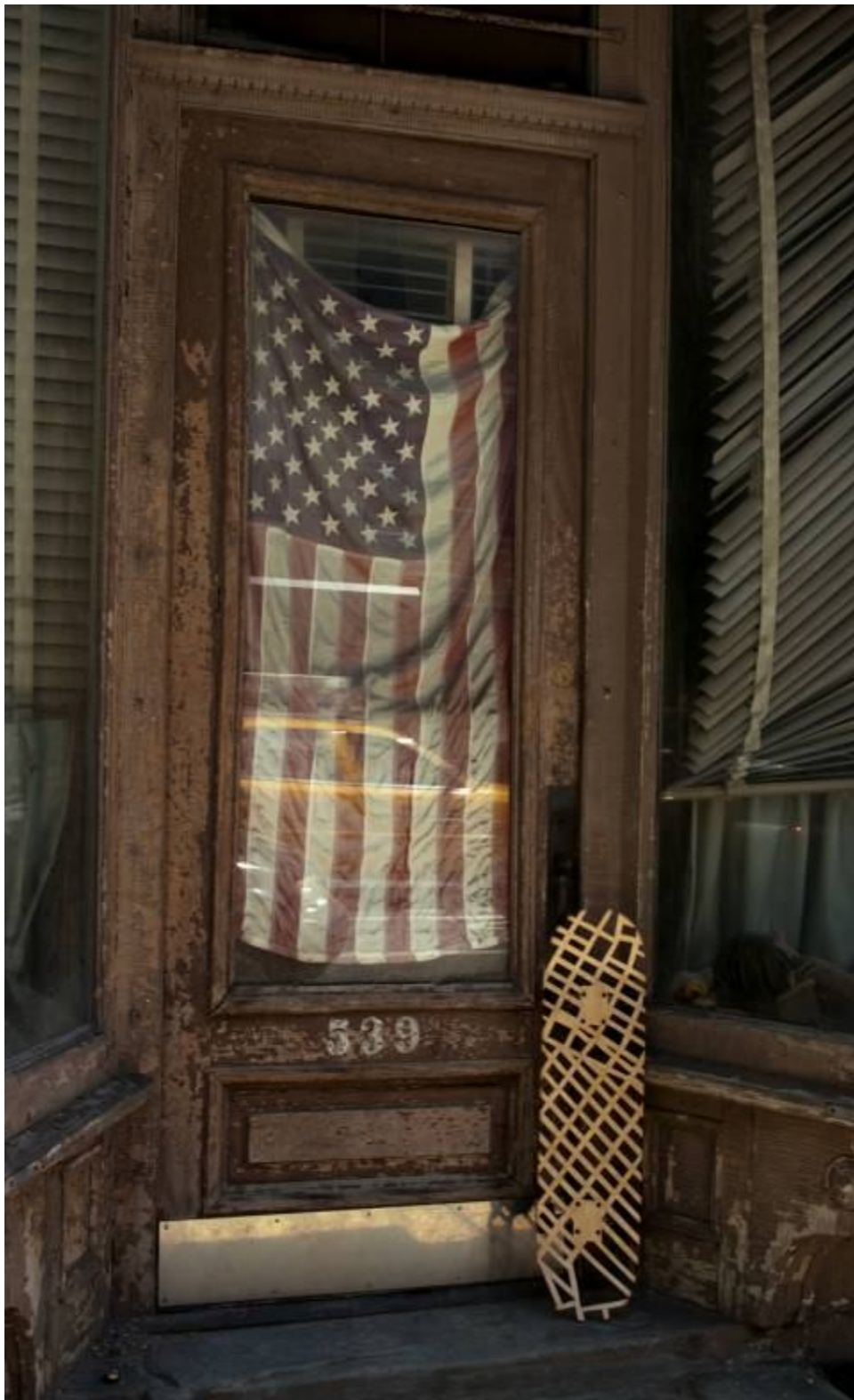
Samuel ROUSSEAU Sans titre, (Board burg street) 2011 Photographie marouflée sur dibon 90 x 60 cm N°1/3 exemplaires