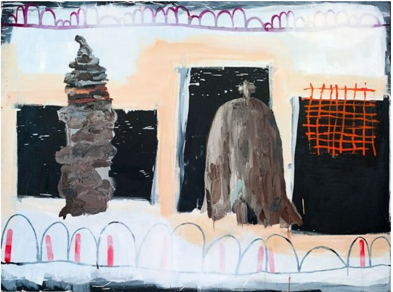
Florence REYMOND Sans titre, série des Montagnes, 2013, huile sur toile, 156x116cm