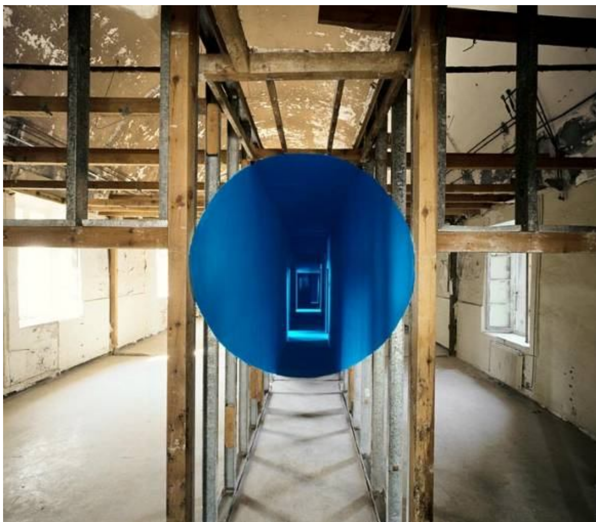
Georges ROUSSE Bastia, 2009 cibachrome marouflé sur dibond, 124x143cm