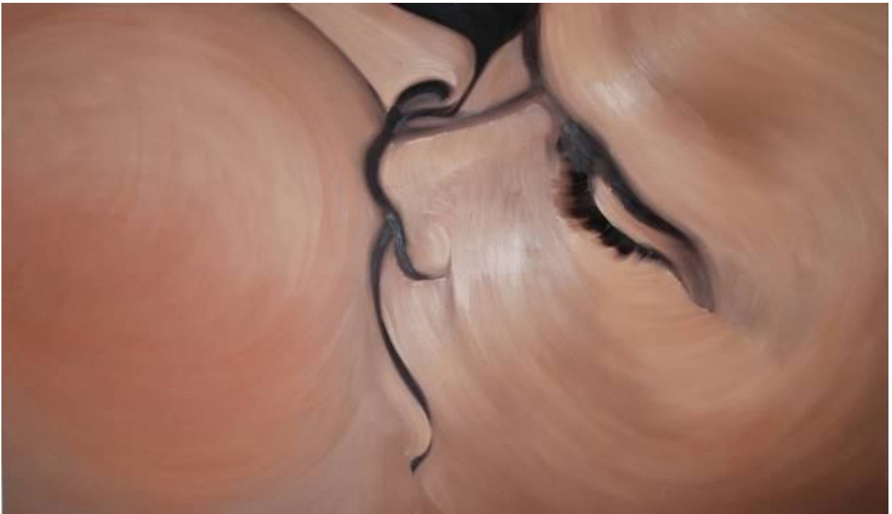
Henni ALFTAN Skin 2012 huile sur toile, 195x114cm