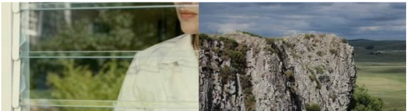
Anne-Sophie EMARD Elisabeth Série Personnage Paysage, duratrans sur caisson lumineux, cadre chêne, 176,5x50 cm