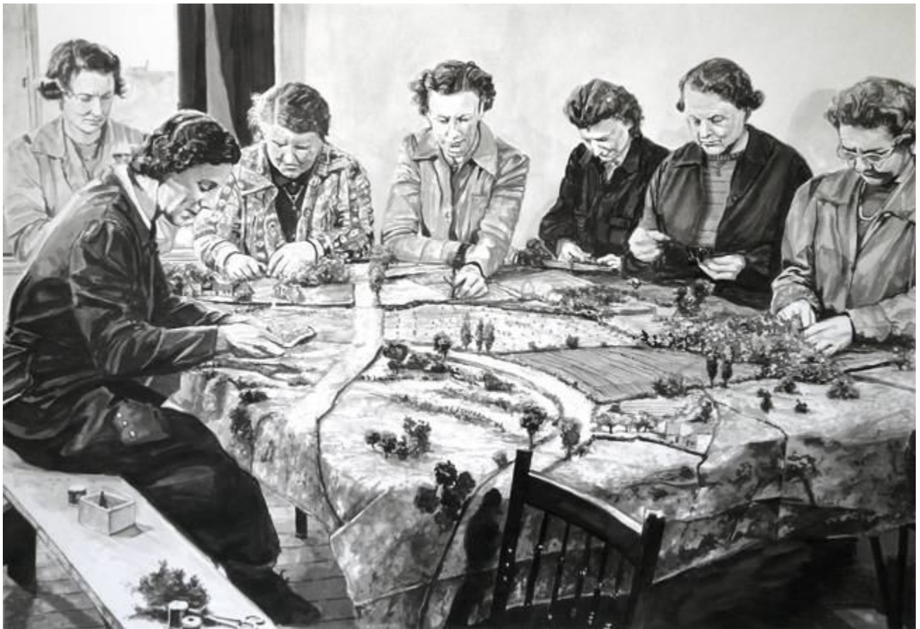
Alain JOSSEAU Les Géographes n°65 2013 aquarelle sur papier, 77x107cm