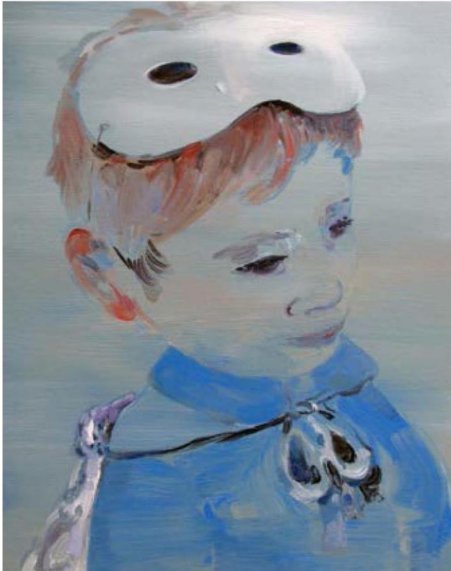
Françoise Pérovitch Sans titre 2013 Huile sur toile 50 x 40 cm Pièce unique