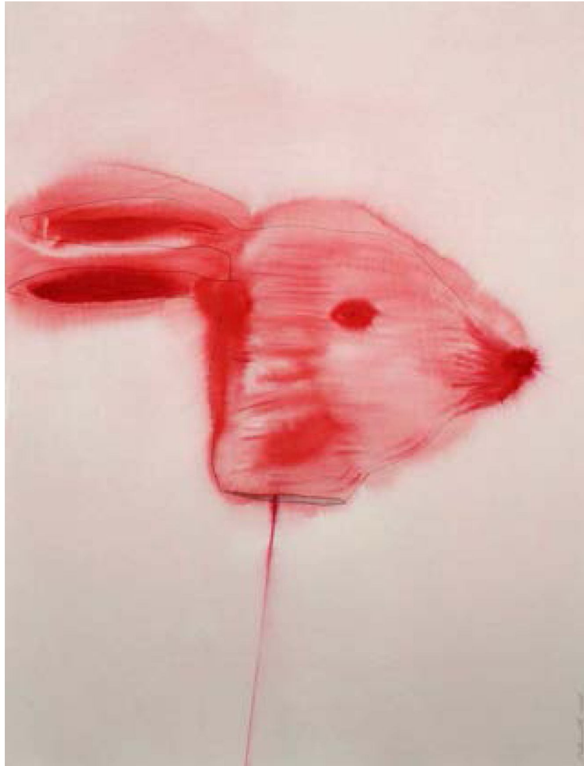
Françoise Pérovitch Sans titre 2008 Lavis d'encre sur papier 80 x 60 cm Pièce unique