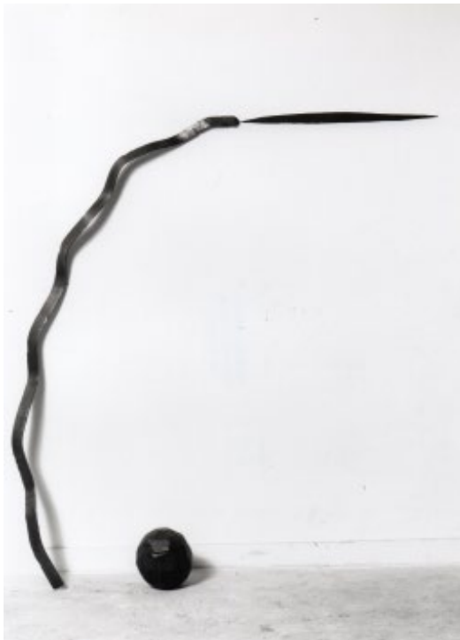
Vladimir Skoda Untitled , 1982 Acier, peinture murale 160 cm, sphere Ø 15 cm