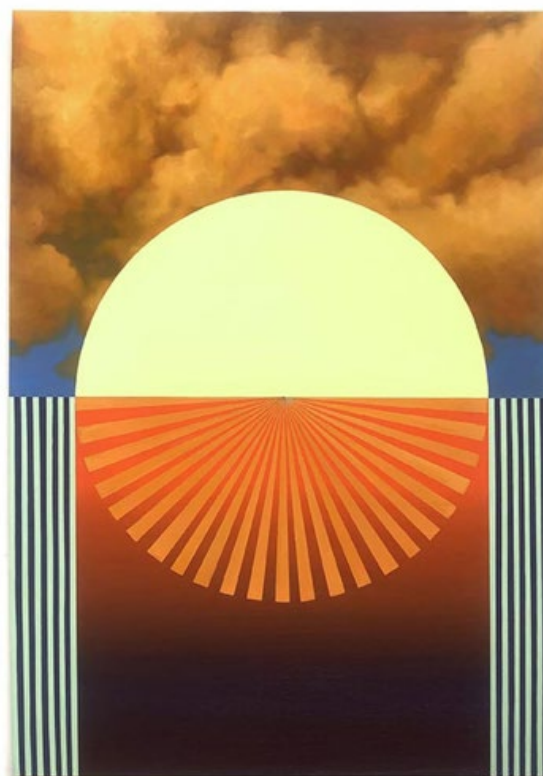
Coraline de Chiara Discobolus , 2023 Huile sur toile 162 x 114 cm