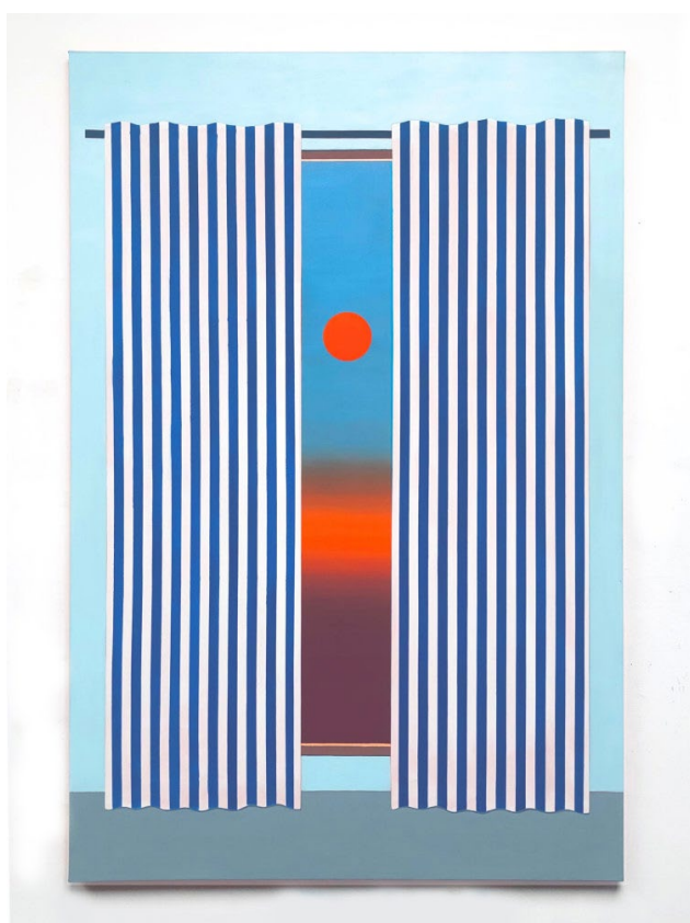
Coraline de Chiara In between , 2023 Huile sur toile 195 x 140 cm