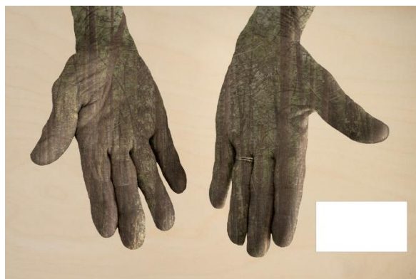
Mãos N°3 (Mains N°3) Photographie 40 X 60 cm, impression directe sur bois, 1 mini-écran vidéo, 1 vidéo HD, 2024