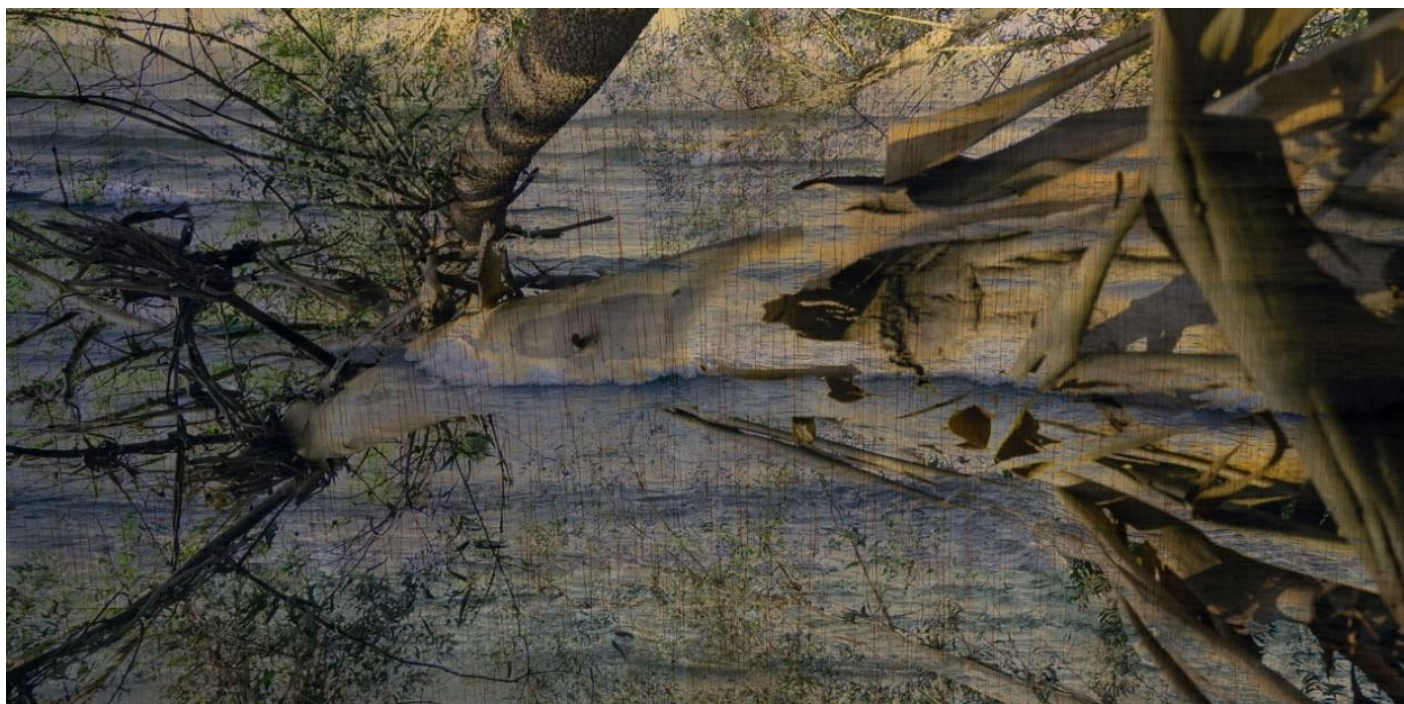
Horizonte (Horizon) , 2024, Photographie, 60 X 120 cm impression directe sur bois contreplaqué cintrable, (matière incurvée)

5-7 rue du Terrail 63000 Clermont-Ferrand - F +33 4 73 92 07 97 37 rue Chapon, 75003 Paris - F +33 1 88 33 98 63 galerie@claire-gastaud.com www.claire-gastaud.com Membre du Comité Professionnel des Galeries d'Art