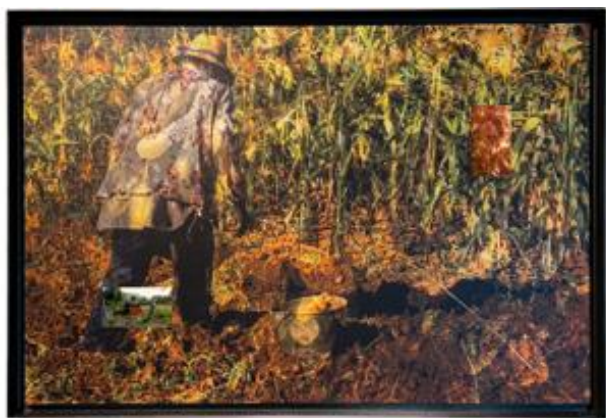
Campo N°2 (Champs N°2) , 2023, Photographie 60 x 90 cm, impression directe sur bois, 2 mini-écrans vidéo, 2 vidéos HD